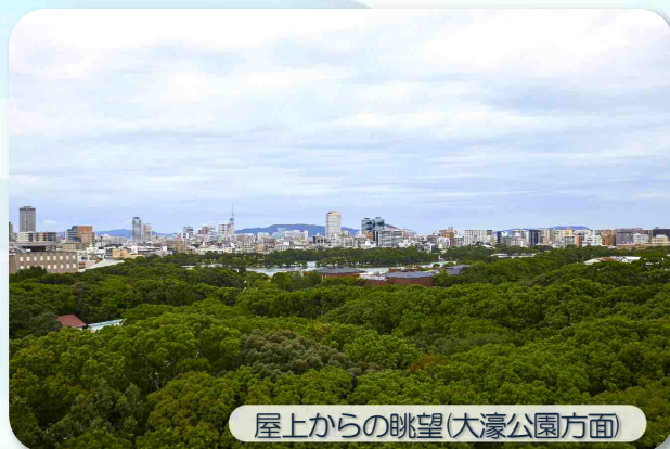
屋上からの眺望(大濠公園方面)

昭和48年(1973年)から令和元年まで向陽ビルに入居していた「珈琲ひいらぎ」も、昨年の11月に戻って来てくれました。所在地は福岡県護国神社の南側、福岡市中央区六本松3丁目16番33号、オフィスは2階となります。賃貸マンション名は社員に公募して「グランドソレイユ護国神社前」と名付けました。計画決定から完成まで6年半を要した建物、そして事務所内をご案内いたしますので、お近くにお越しの際は是非お立ち寄りください。