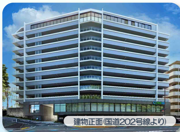
建物正面(国道202号線より)

建物はRC造地下1F地上10F建て(実際は地上11F建て)、構成はテナント2戸、オフィス(本社使用部分430.44㎡)、賃貸住宅(1LDK~3LDK)48戸としました。賃貸住宅エントランスを上り坂(東側)に配置し、地下駐車場(テナント用)は国道側に、1F駐車場(オフィス用)は上り坂側に入り口を設け、21台分の駐車スペースを確保しました。テナント・オフィス・住宅の動線を区別しながらも、駐車場・駐輪場など一部の共用部分は、それぞれから行き来できるような配慮がなされています。