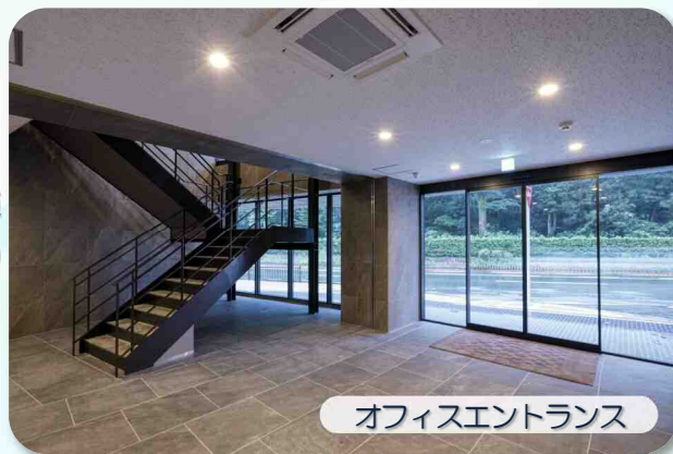
オフィスイントランス