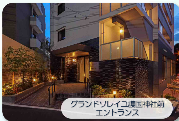
グランドソレイユ護国神社前 エントランス